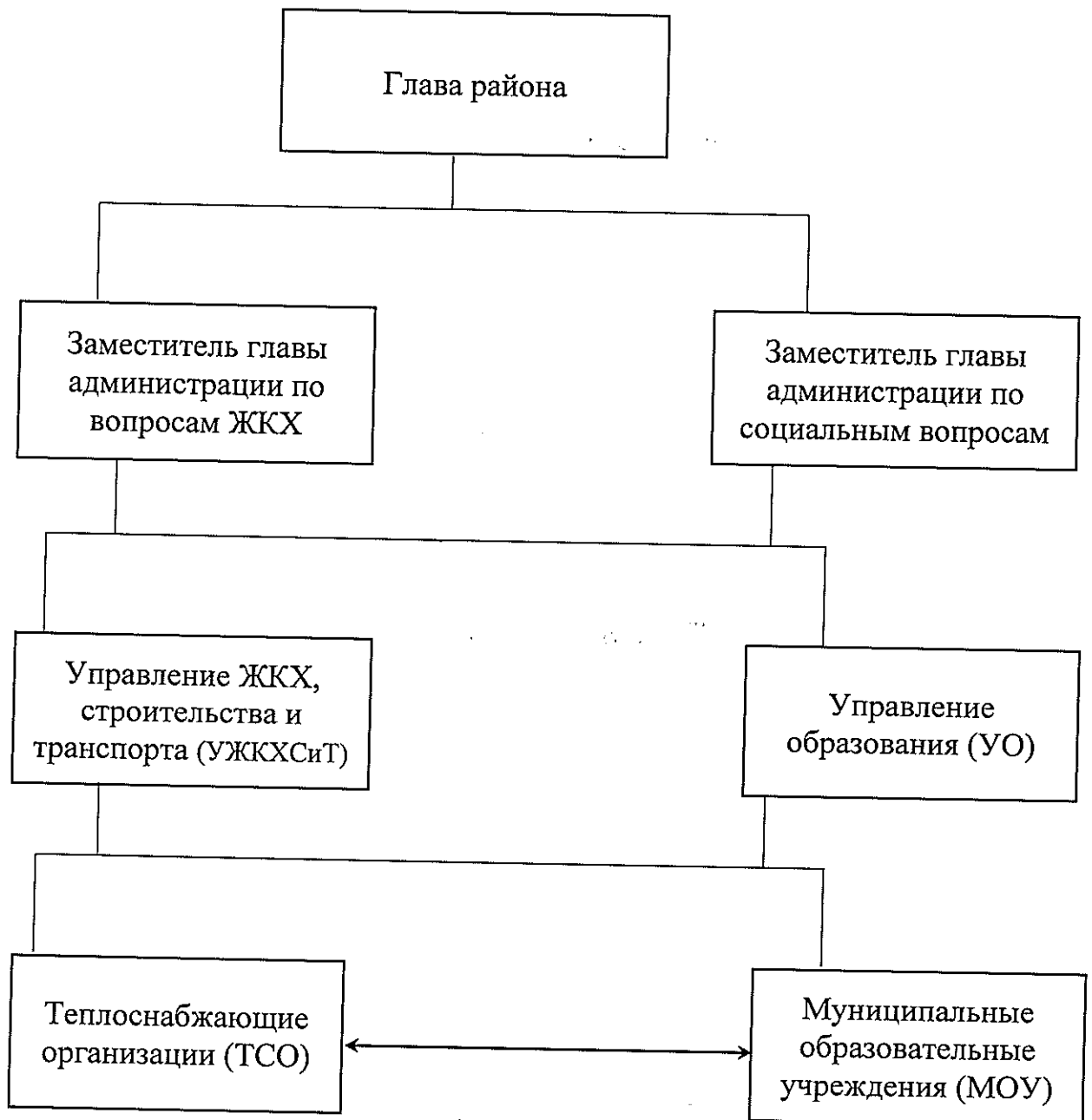
СХЕМА взаимодействия исполнителей мероприятий Программы