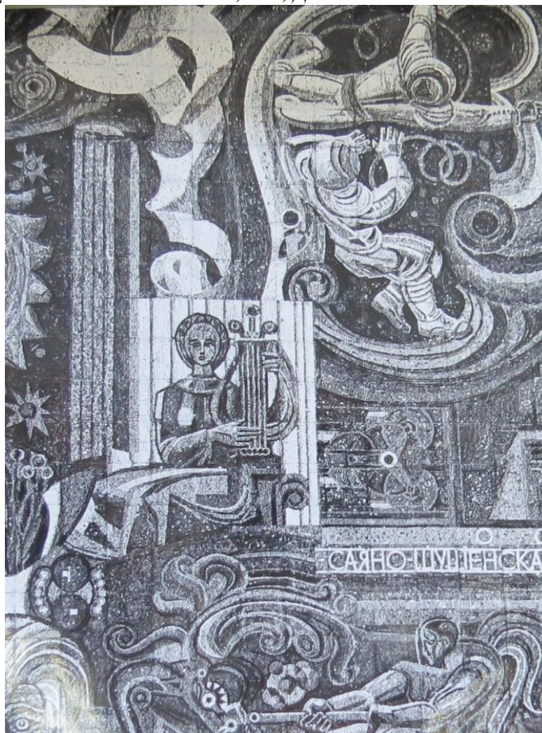
Рис. 6. Фото из личного дела Сокола Владимира Петровича. Фото фрагмента монументально-декоративного панно «Советская Сибирь». Автор Сокол В.П., г. Новосибирск, ул. Немировича-Данченко, 104. ГАНУ. Ф-Р-1742, О-3, Д-23