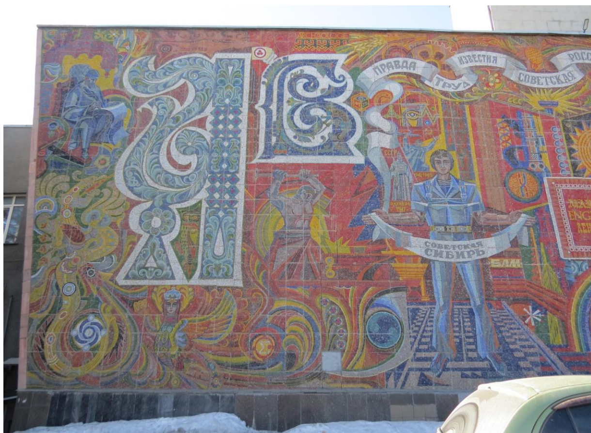
Рис. 2. Монументально-декоративное панно «Советская Сибирь», расположенное по адресу г. Новосибирск, ул. Немировича-Данченко, 104. Фрагмент слева.