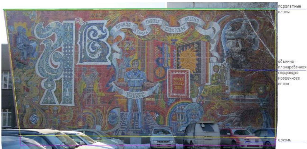
Рис. 1. Монументально-декоративное панно «Советская Сибирь», расположенное по адресу г. Новосибирск, ул. Немировича-Данченко, 104. Общий вид мозаичного панно.