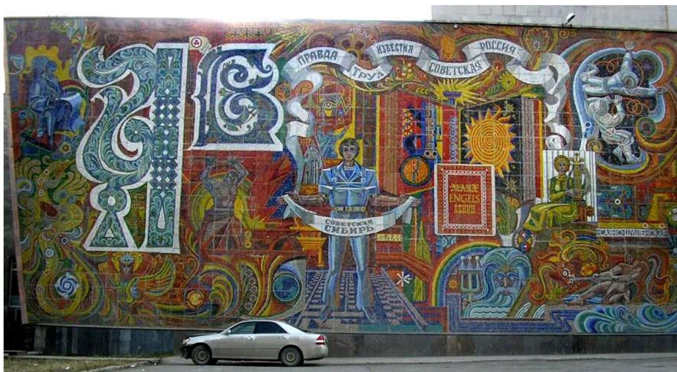
Рис. 7. Фото монументально-декоративного панно «Советская Сибирь», расположенного по адресу: г. Новосибирск, ул. Немировича-Данченко, 104. Фото 2015 г.