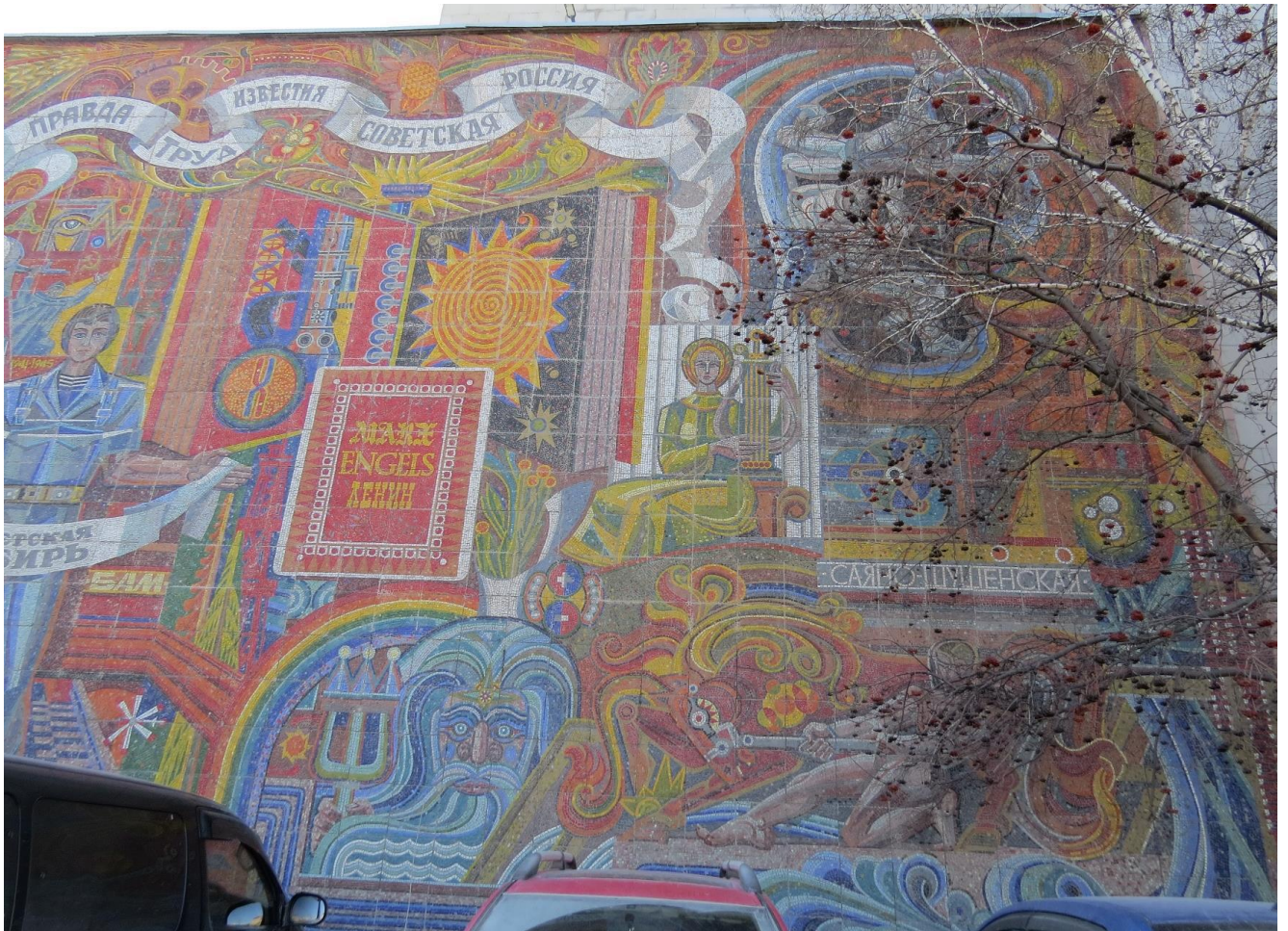
Рис. 3. Монуменально-декоративное панно «Советская Сибирь», расположенное по адресу г. Новосибирск, ул. Немировича-Данченко, 104. Фрагмент справа.