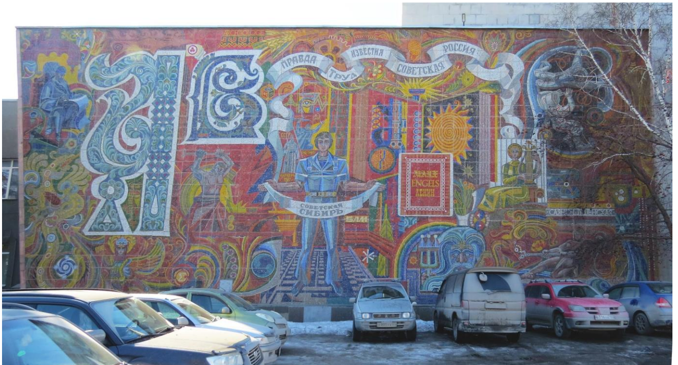
Рис. 4. Монуменально-декоративное панно «Советская Сибирь», расположенное по адресу г. Новосибирск, ул. Немировича-Данченко, 104. Общий вид мозаичного панно.