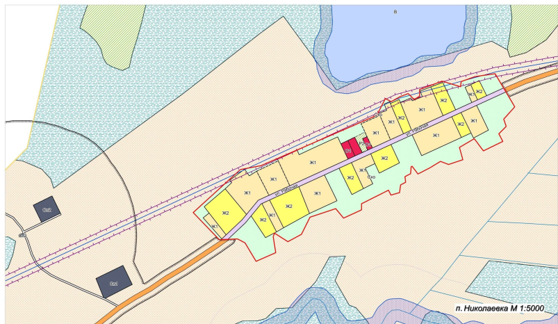
п. Николаевка М 1:5000