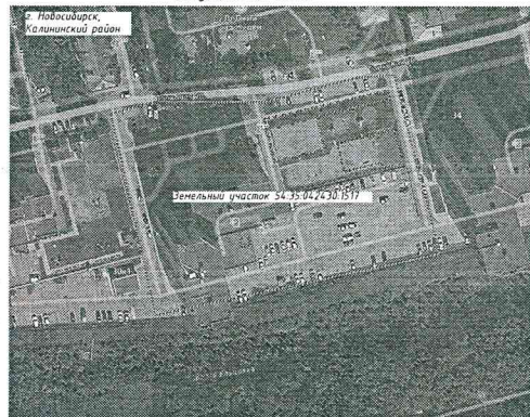
Земельный участок 54.35-04/24-30-15/17