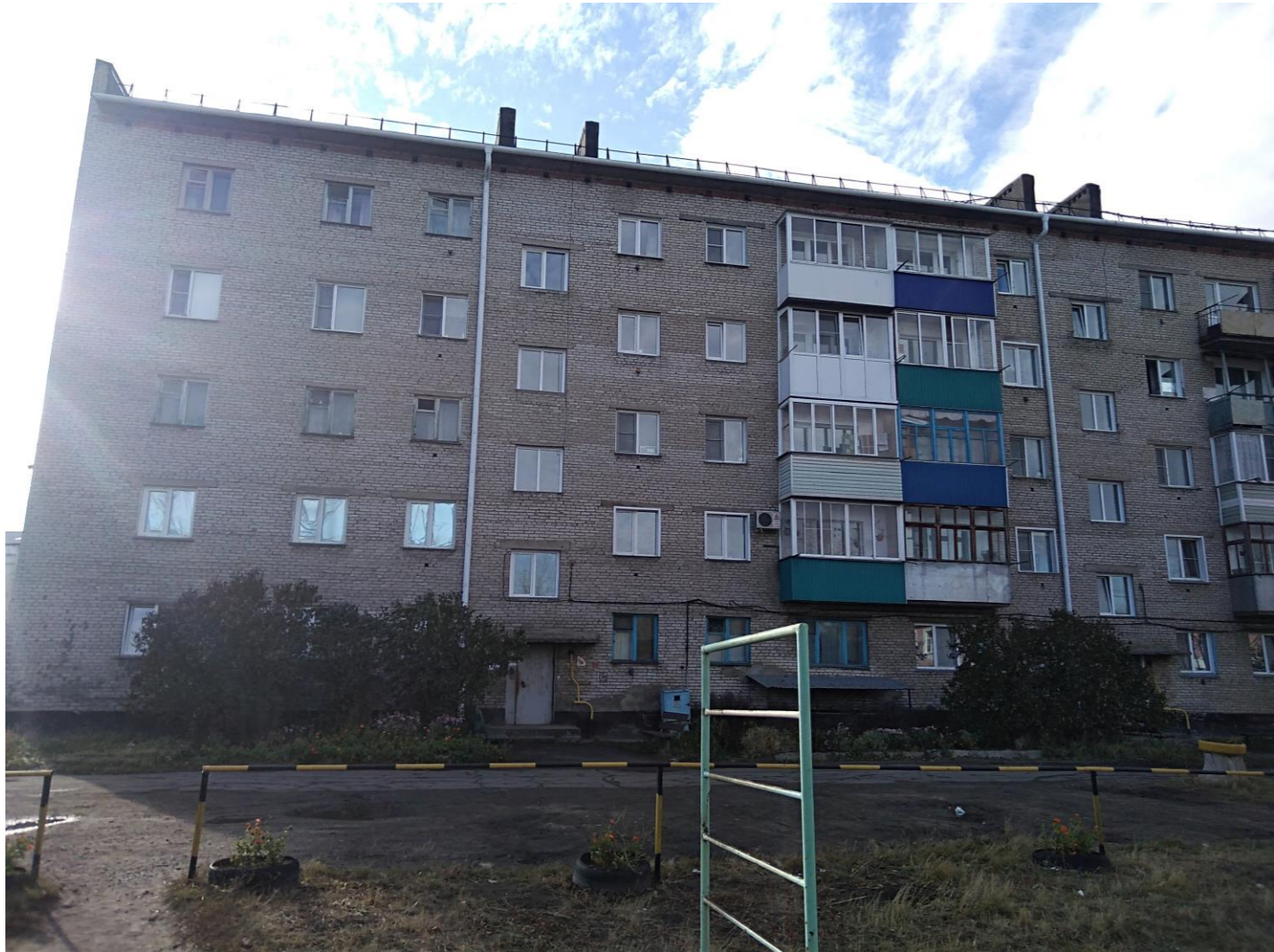
Вид со стороны МБОУ СОШ №5