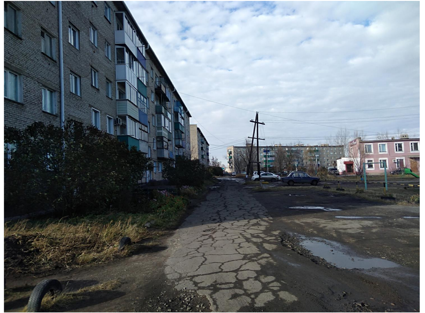
Вид вдоль жилого дома по ул. Тургенева 84

В данный момент территория не благоустроена. Площадки (детские, хозяйственные и пр.) и малые архитектурные формы отсутствуют. Элементы озеленения (деревья, клумбы, кустарники) отсутствуют или находятся в аварийном состоянии.