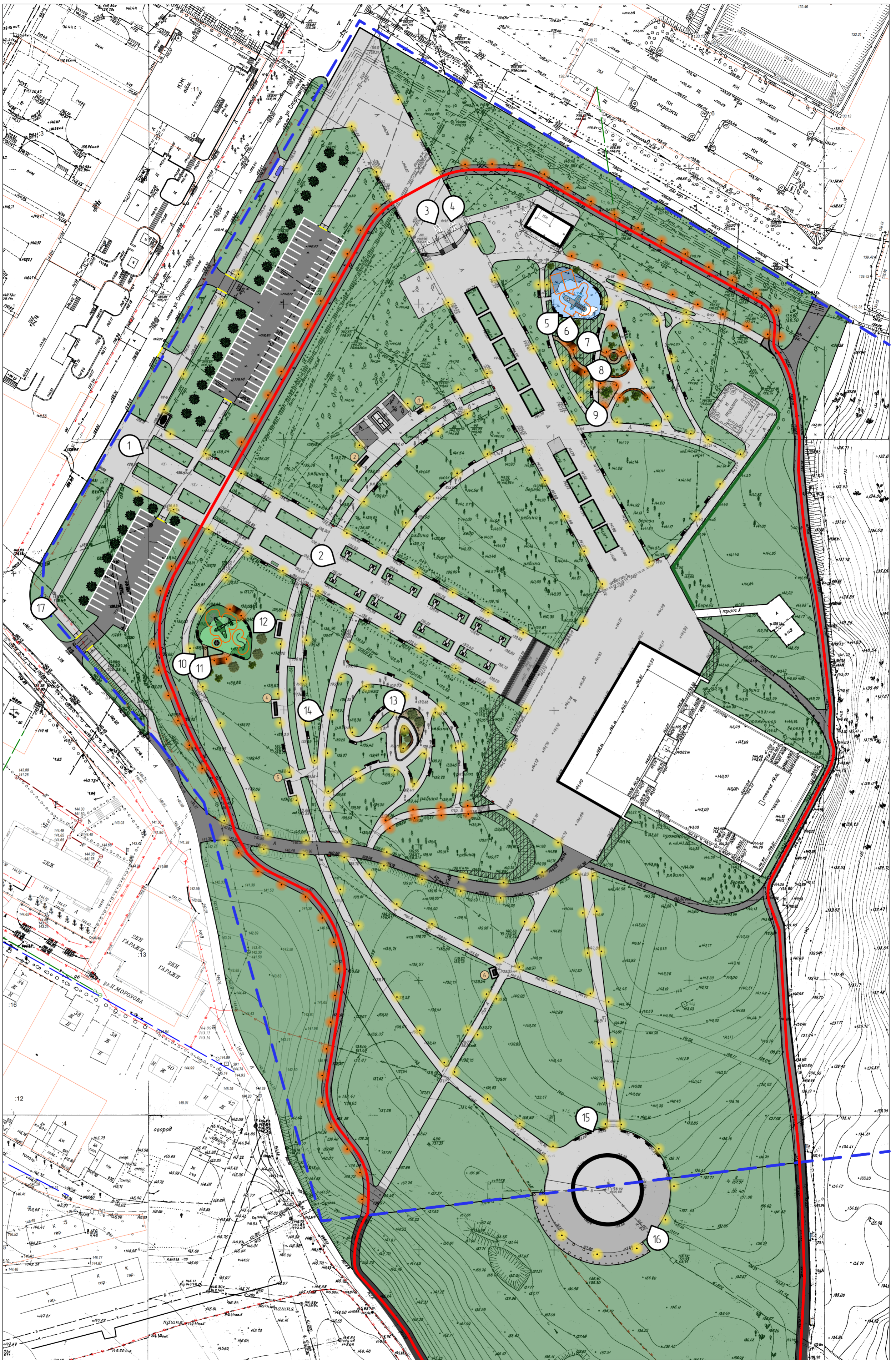
Схема видовых точек